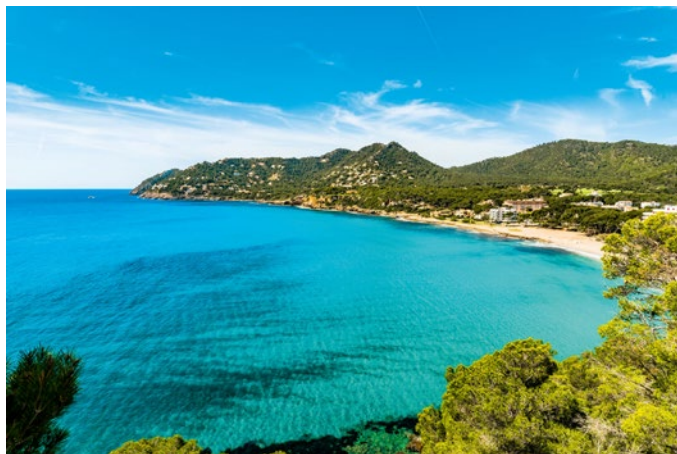
Canyamel ist ein überschaubarer und entspannter Küstenort mit viel typisch mallorquinischem Charme und Lebensgefühl.

Seit fast 100 Jahren macht schauinsland-reisen Urlaubsträume wahr. Der Duisburger Reiseveranstalter ist von einem kleinen regionalen Unternehmen zu einem der größten Reiseveranstalter Europas gewachsen. Über 380 Mitarbeiter kümmern sich im Duisburger Innenhafen mit viel Leidenschaft um die schönste Zeit des Jahres und sorgen dafür, dass aus dem Urlaubstraum ein Traumurlaub wird. Egal ob Badeurlaub, Fernreise, Familienurlaub, Kreuzfahrt oder Wellnessstrip – im breit und vielseitig angelegten Angebot von schauinsland-reisen bleiben